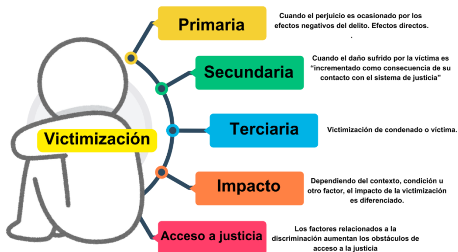
DIAGRAMA IV: Elementos de la revictimización.

Fuente: elaboración propia a partir de David Lovatón Palacios, «Atención integral a las víctimas de violaciones a los derechos humanos. Algunos apuntes desde la victimología», Revista Instituto Interamericano de Derechos Humanos , (2009).