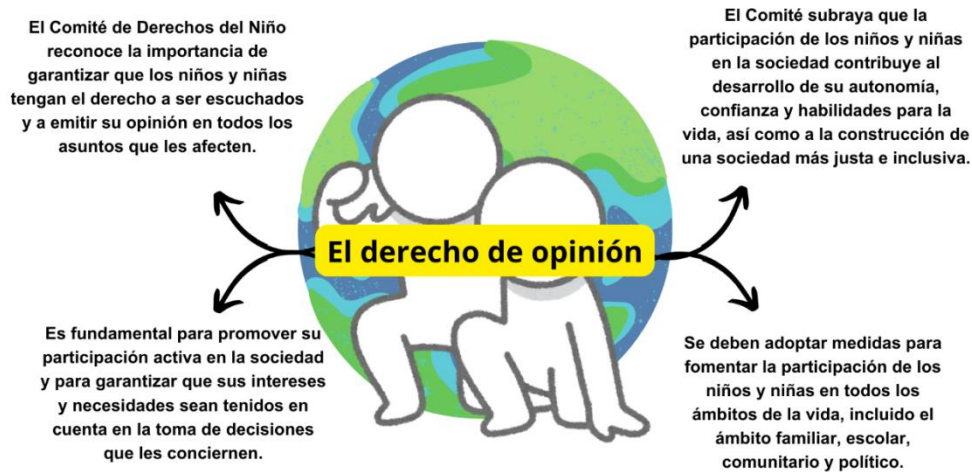
DIAGRAMA II: Dimensiones del derecho de opinión según el Comité de Derechos del Niño.