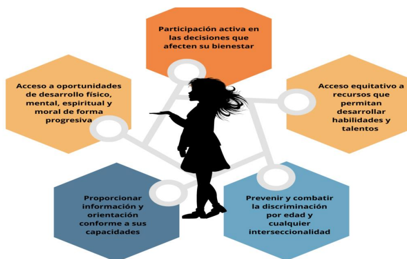
DIAGRAMA V: Elementos del ejercicio progresivo de las facultades.

Fuente: elaboración propia a partir de lo dispuesto por William Homer Hernández en el artículo «La Autonomía Progresiva del Niño y su Participación en el Proceso Judicial».