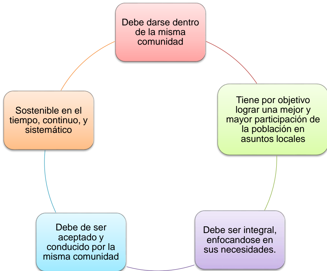
Figura 1. Características del Desarrollo Comunitario