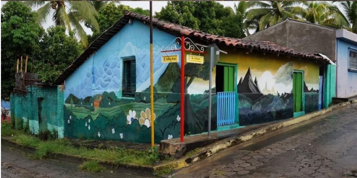
Imagen 4. (Municipio de Tapalhuaca, La Paz, 26 de julio de 2021) Murales hechos por jóvenes capacitados por la GTZ en Tapalhuaca por el surgimiento de “Pueblos Vivos”.