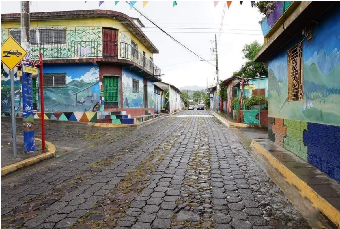
Imagen 5. (Municipio de Tapalhuaca, La Paz, 26 de julio de 2021) Murales creados por habitantes del municipio, mediante el involucramiento de jóvenes en talleres de pintura.