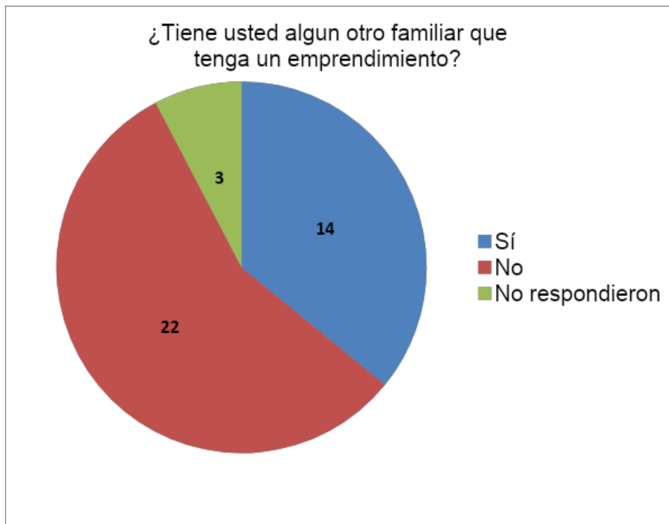
Gráfica 1: Resultados obtenidos por medio de los participantes

Como se observa en la gráfica de pastel, 22 personas respondieron que sí tenían otro familiar que estaba emprendiendo, 14 contestaron que no y 3 no respondieron la interrogante.